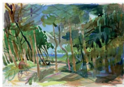
"Dybesøstien", akvarel udført af Flemming H - en lokal Rørvigkunstner.