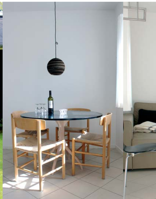
Velindrettede ferieboliger med høj komfort.